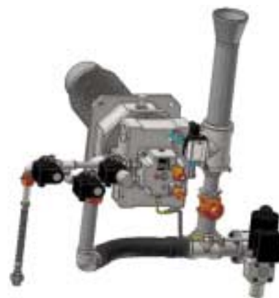
Рис. 2. REKUMAT MSJ 200 для прямого нагрева

смешивания струи пламени с отходящим газом, полное сжигание природного газа и оптимальное преобразование энергии.